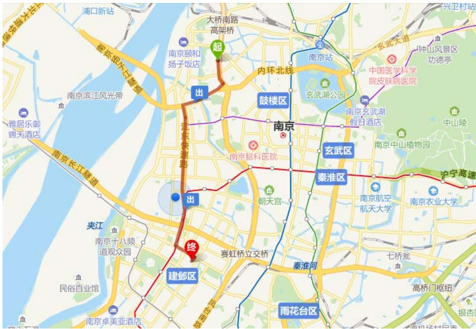
南京市方源金陵国际酒店——南京高校